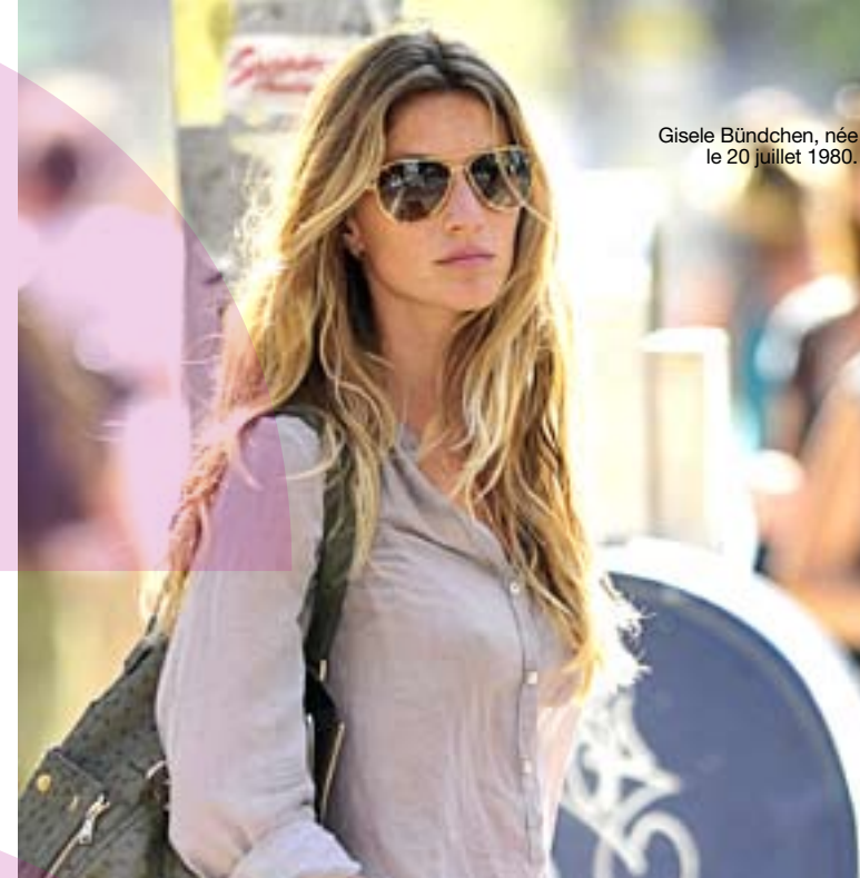
Gisele Bündchen, née le 20 juillet 1980.

Votre plus grande richesse réside dans votre bonne santé affective. Certes, les six mois un peu chahutés que vous venez de vivre vous ont mis les nerfs en pelote, mais il s'agit maintenant de trouver la paix intérieure, surtout dans votre vie personnelle. La voie à suivre ? Principalement, baisser votre garde. Laissez votre amoureux décider de ce que vous ferez cet été, vous vous consacrez d'autant mieux à vous-même, et à vous seulement. En investissant ainsi votre temps et votre énergie, vous vous verrez généreusement récompensée : un ancien projet créatif renaîtra soudain, un rituel de méditation ou de gymnastique prendra place dans votre quotidien, et vous vous sentirez davantage maître de vous-même. Ce nouvel équilibre intérieur ne pourra avoir que des résultats positifs sur votre relation, de jour comme de nuit.