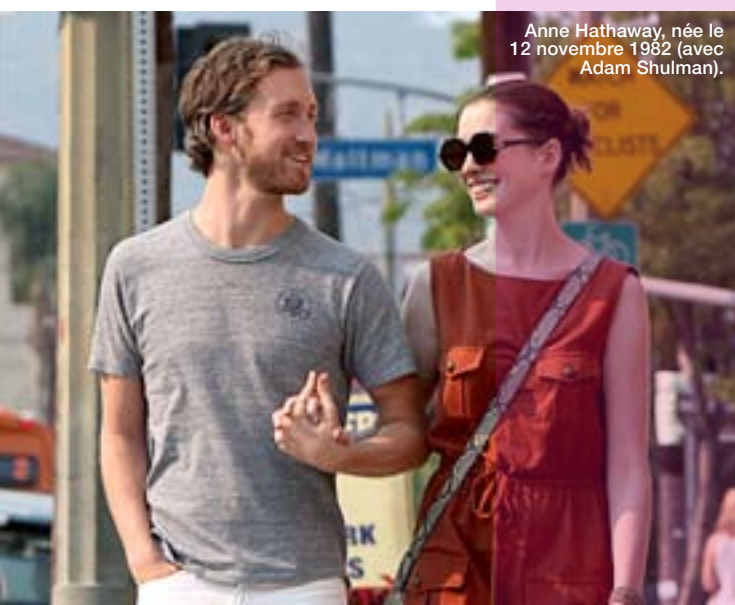
Anne Hathaway, née le 12 novembre 1982 (avec Adam Shulman).

Vous pouvez parfois vous montrer très conservatrice, méfiante, voire carrément fermée. Généralement, c'est parce que vous tenez à éviter de gaspiller votre temps et votre énergie. Forte de votre expérience conjugale, vous savez que le relâchement peut engendrer un sacré désordre dans un couple. Mais cet été, si vous essayez encore une fois de resserrer la vis, vous finirez par imposer une ambiance un peu lourde dont ne pourra qu'émerger une insatisfaction de la part de votre amoureux... Sauf à changer de tactique ! Si vous parvenez à cesser de prendre le passé comme référence absolue du présent, que vous faites preuve d'un tout petit peu de souplesse et que vous réalisez qu'une relation, si ancienne ou installée soit-elle, peut se révéler sous un jour nouveau, alors vous aurez la chance d'être surprise, en bien, forcément. Vous connaîtrez un été et une rentrée pleins de beaux imprévus. Ouverte à toutes les aventures, vous explorerez (en chambre ou ailleurs) une nouvelle facette de la vie de votre couple.