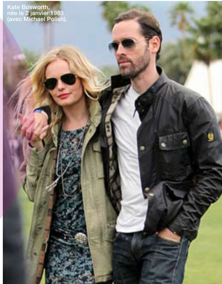
Kate Bosworth, née le 2 janvier 1983 (avec Michael Polish).

Votre modus amorandi pourrait ces temps-ci être qualifié d'"attachement distant". On vous aura rarement vue aussi fidèle à vous-même, affichant ouvertement votre nature profondément double. Dans votre bouche, un oui pourra dire non, et vice versa : la communication ambivalente sera votre spécialité. Pas facile à décrypter pour un amoureux d'un soir ou d'un été. Sauf que le cosmos vous demandera tôt ou tard de clarifier la situation et d'admettre qu'une certaine confusion règne. Car si vous vous sentez perplexe d'un côté, vous n'en serez que plus embourbée de l'autre. Et vous qui faites souvent l'apologie de la franchise, mettez donc vos principes en application ! Les obstacles disparaîtront peu à peu, vos projets avanceront à la vitesse grand V, y compris vos envies amoureuses. Corollaire agréable, l'argent coulera à flots, vos amis vous entoureront, et, surtout, la target que vous cibleriez sera ravie de se mettre à votre service.