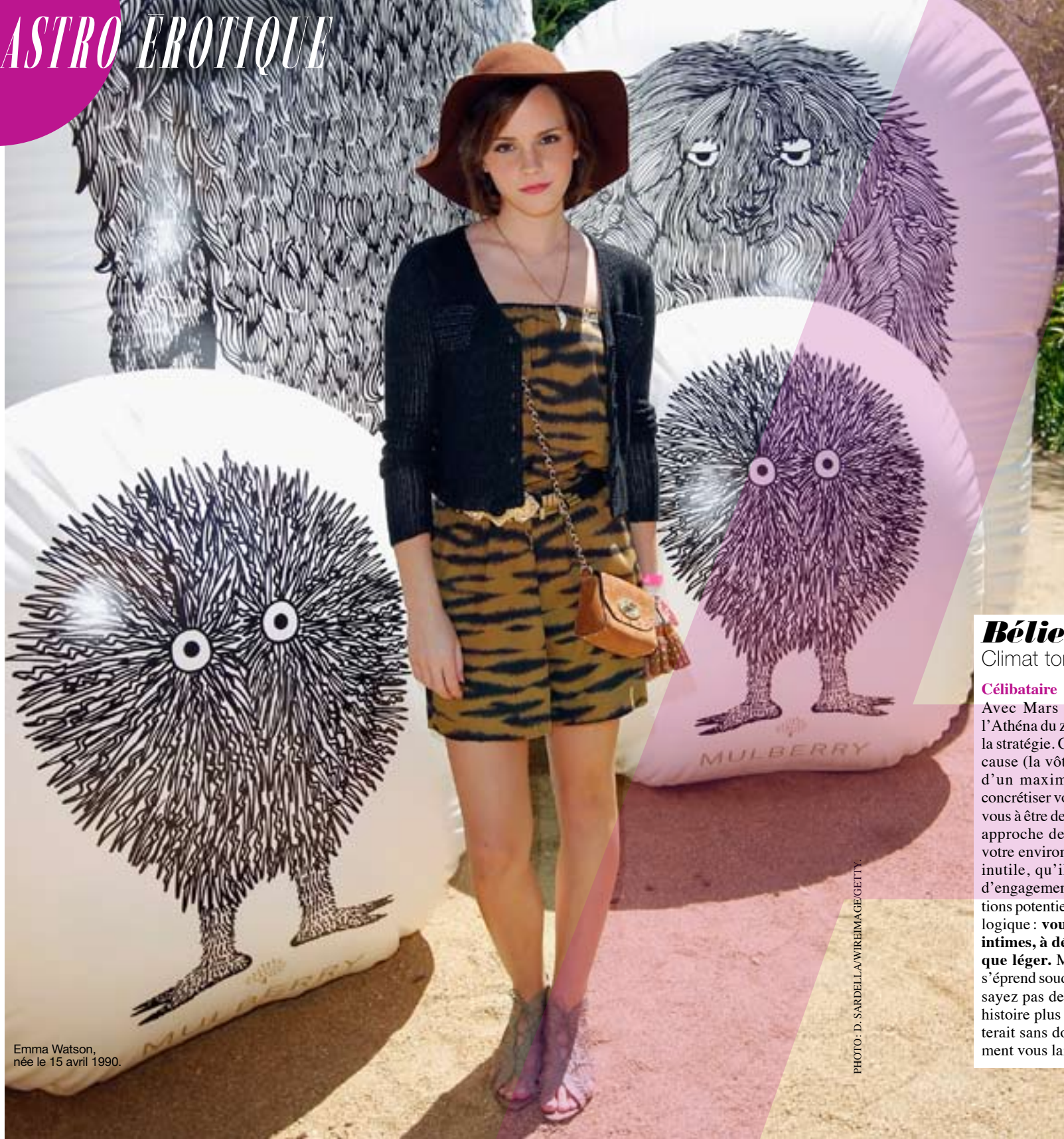
Emma Watson, née le 15 avril 1990.